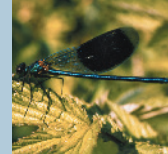
gebänderte Prachtlibelle ●